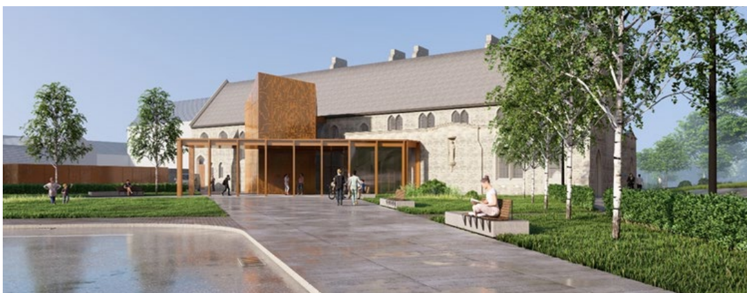
Impresión artística del County Monaghan Thrive Site

Los proyectos deben incorporar los principios de la New European Bauhaus –promover soluciones que sean sostenibles, inclusivas y atractivas.