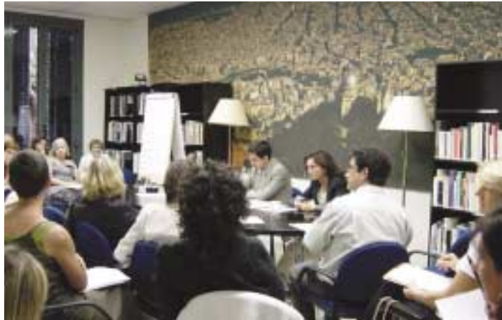
Reunió de la Subcomissió de Capital humà

El resultat final dels seus treballs ha estat objecte d'una edició en la col·lecció de documents de treball del Pla. En qualsevol cas i a tall de resum, molt esquemàtic, es destaquen els temes que han estat analitzats per cadascuna d'elles, segons la descripció següent: