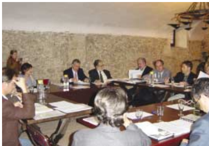
Comissió delegada al castell del Papiol

En el cas de la reunió realitzada en el municipi del Papiol, l'objectiu va ser analitzar l'informe intermedi de les subcomissions de prospectiva, que ja havien treballat durant tres mesos. A l'informe s'avançaven unes primeres conclusions del debat i es destacaven els temes més recurrents en cada grup. També es va presentar la proposta d'esborrany referida a la gestió de l'aeroport de Barcelona i el mapa dels 43 grans projectes metropolitans.