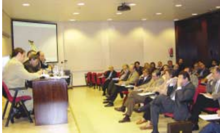
Reunió de la Subcomissió de Dinamització econòmica