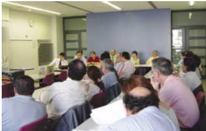
Reunió de la Subcomissió de Lideratge i globalització

La subcomissió ha centrat el seu debat a l'entorn de tres temes: habitatge, transport i logística i el model territorial . De les propostes estratègiques plantejades, es poden destacar els aspectes següents: No segregació de l'espai en àrees d'activitat i àrees d'habitatge, Densificació urbana, política d'habitatge de protecció oficial, integració espacial de les famílies immigrants, la logística a l'interior de les ciutats, la logística de llarga distància i les infraestructures que es requereixen, el transport públic i la seva intermodalitat, la xarxa viària, potenciació de les polaritats urbanes, els espais lliures territorials, els components mediambientals i la definició d'un model territorial metropolità.