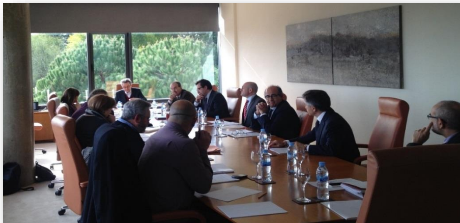
Reunió de la Comissió Assessora (27 de gener de 2015, ESADE)