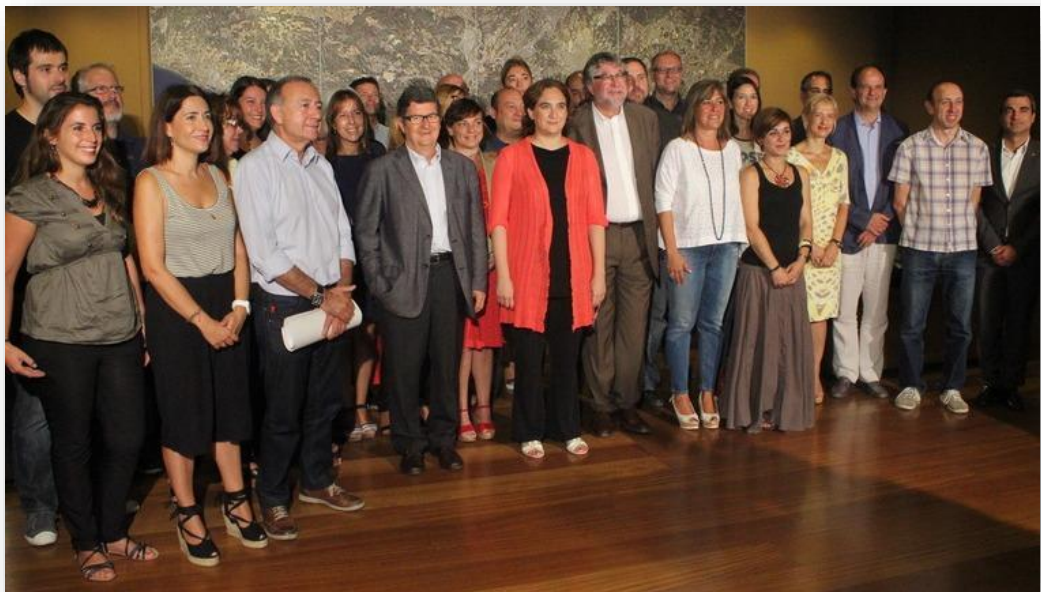
Reunió del Consell Metropolità (23 de juliol de 2015)

Mentre aquests canvis no es produeixen, als òrgans de govern corresponents (Consell Rector per als membres de la Comissió Executiva i el Consell General per als membres del Consell Rector), continuen amb els càrrecs vigents els membres que foren proposats en el seu dia per l'AMB.