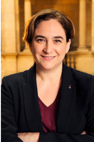
Ada Colau Presidenta de l'Àrea Metropolitana de Barcelona i del Pla Estratègic Metropolità de Barcelona

Quan el juny de 2015 vaig ser escollida com a alcaldessa de Barcelona i al juliol com a presidenta de l'Àrea Metropolitana de Barcelona (AMB) vaig expressar la meua ferma voluntat de lluitar contra les desigualtats socials atenent les necessitats dels col·lectius desfavorits i garantir la transparència de les institucions donant més protagonisme a la ciutadania i aprofitant el potencial col·lectiu per avançar en la coproducció de polítiques públiques.