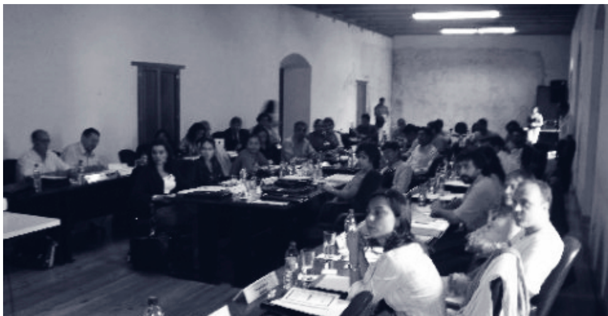
Antigua (Guatemala), juliol de 2005

La planificació concurrent aporta elements innovadors per potenciar uns models de desenvolupament econòmic i social de les ciutats en què es prioritzi, com a factors estructurants i no marginals, els vectors mediambientals i els del model econòmic, abans d'una formulació concreta dels models urbanístics que defineixen l'ordenació d'un territori i assegurin la seva coherència a mig i llarg termini.