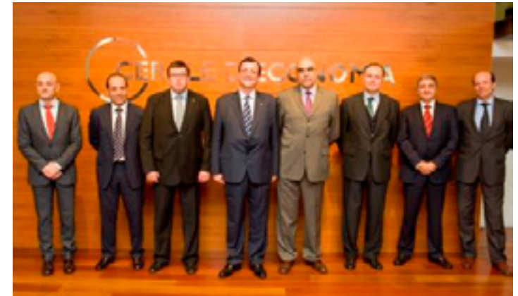
8 de febrer, Cercle d'Economia

També varen expressar la conveniència de modificar el llenguatge i deixar d'anomenar-los “sectors tradicionals” ja que, gràcies al seu esforç en innovació, es poden considerar també com a sectors emergents. Es va destacar també que el creixement dels sectors emer-