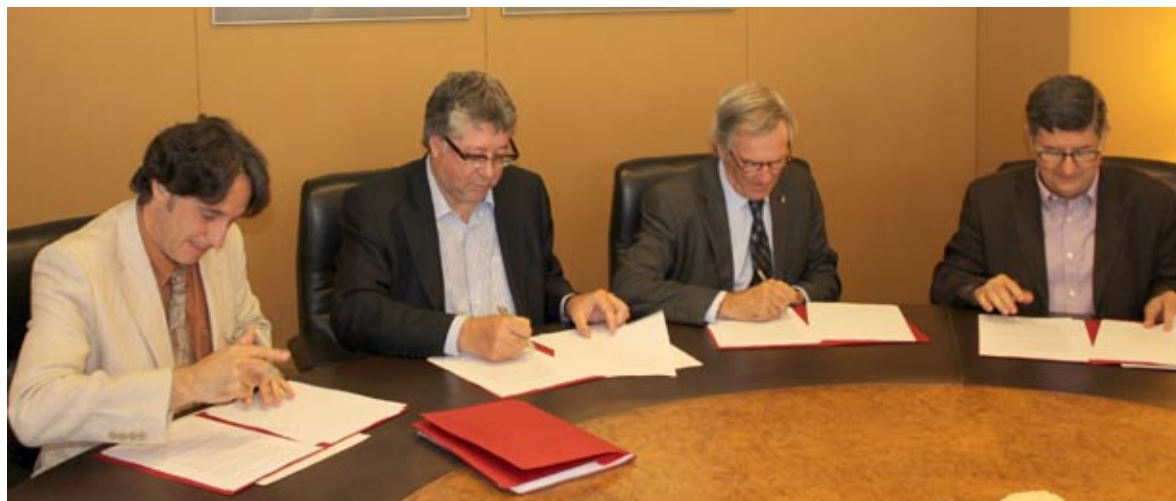
Acte de constitució de l'AMB (21 de juliol)

E l passat 21 de juliol es va constituir l'Àrea Metropolitana de Barcelona (AMB), a l'empara de la Llei 31/2010, del 3 d'agost de 2010. L'AMB és la nova organització institucional de la gran conurbació urbana formada per trenta-sis municipis que aglutina en una única institució els tres ens ja existents: la Mancomunitat de Municipis, l'Entitat del Medi Ambient i l'Entitat Metropolitana del Transport. L'acord per al govern de l'Àrea Metropolitana de Barcelona ha estat signat pels representats de CiU, PSC, ICV i ERC.