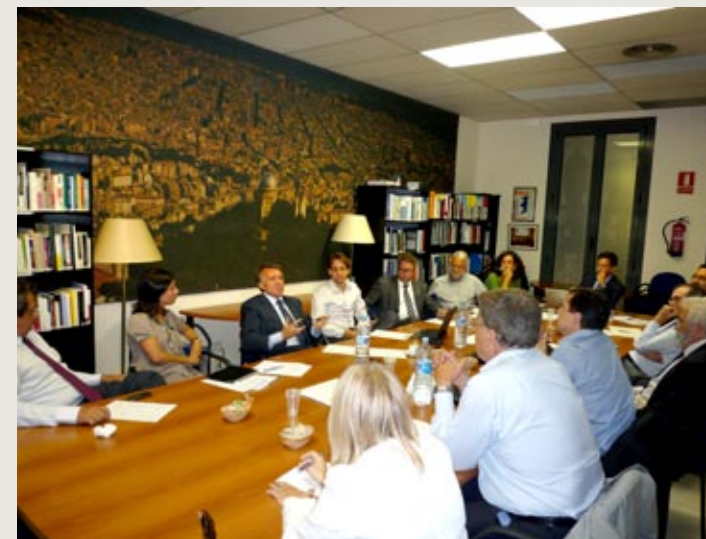
Primera reunió de la Comissió d'Atracció de Talent (13 de setembre, PEMB)