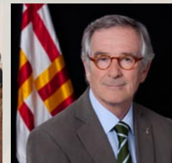
Tercera sessió plenària de la Comissió d'Estratègia, presidida per l'alcalde de Barcelona (11 de juliol, Ajuntament de Barcelona)