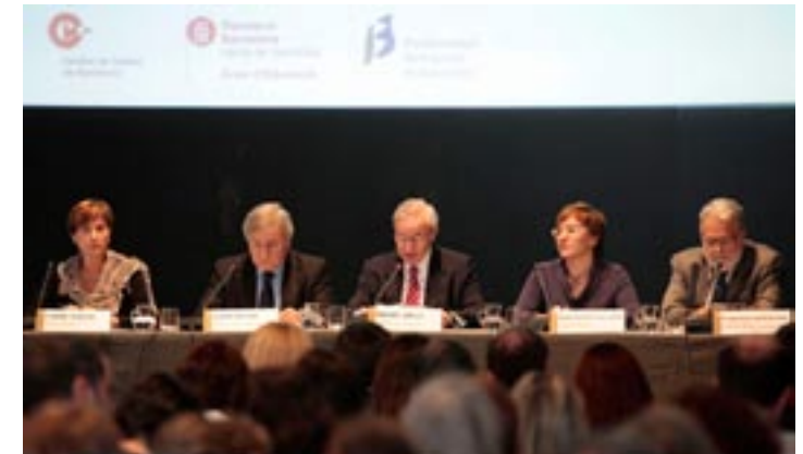
Presentación del informe en la Llotja de Mar (22 de octubre)

Si desea ampliar la información sobre este informe, puede consultar la página web de la Fundació BCN Formació Professional www.fundaciobcnfp.cat .