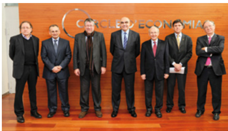
10 de febrero, Círculo de Economía

En el acto se destacó la importancia de la buena sintonía existente entre estas tres ciudades y la necesidad de trabajar de forma conjunta.