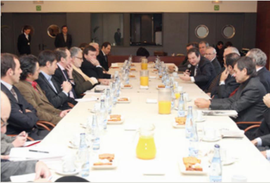
12 de enero, Museo Picasso