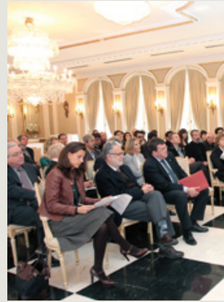
13 de abril, Palacete Albéniz