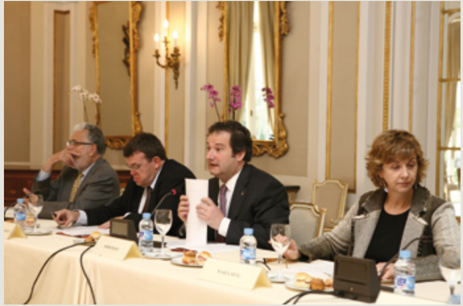
7 de mayo, Palacete Albéniz