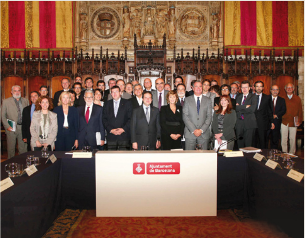
Acto de presentación de las conclusiones de la Comisión de Prospectiva (26 de mayo, Saló de Cent)