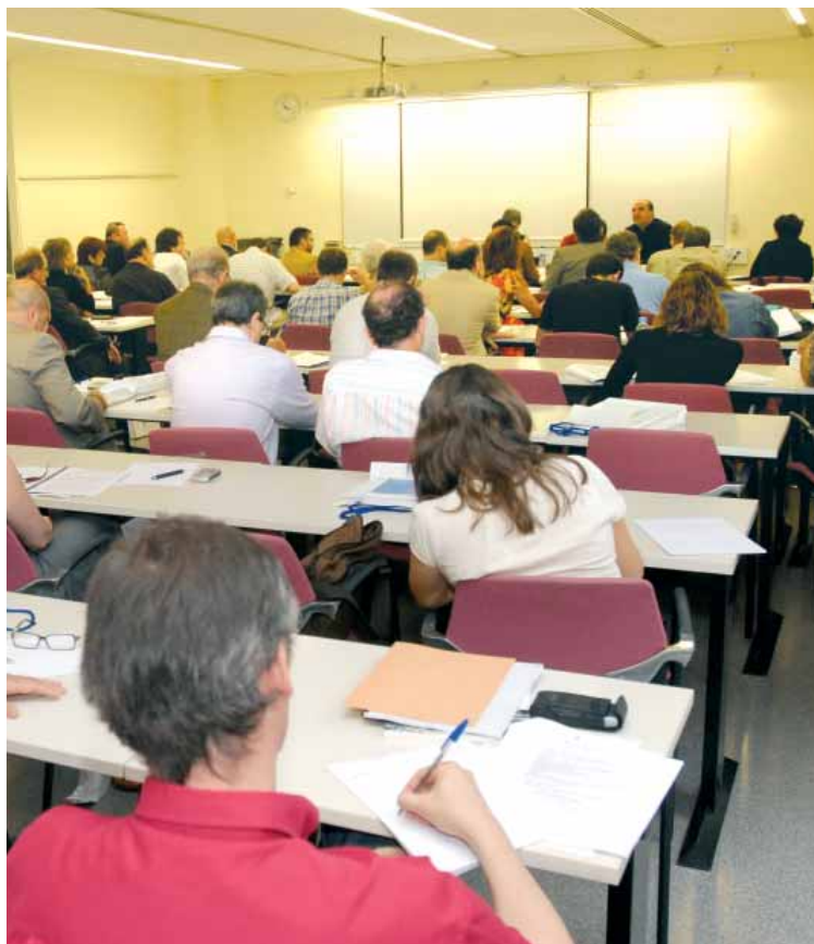
Los asistentes participan en una de las seis sesiones temáticas.

nología, el turismo y la cultura, los media y el entretenimiento, el diseño y la arquitectura, las TIC y las clean tec (tecnologías limpias).