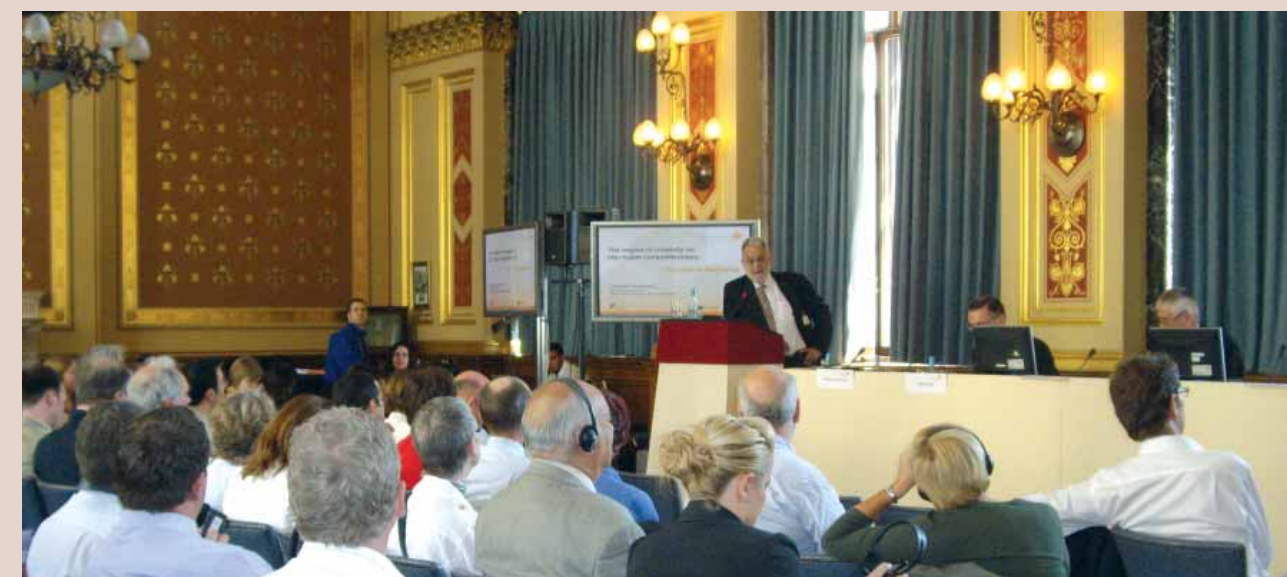
Conferencia final de la red Compete. Londres, 4 y 5 de junio de 2007.

Nota: Si desea más información sobre el proyecto, puede consultar la página web: www.compete-eu.org